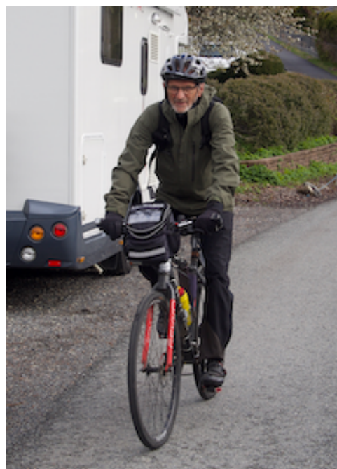
Sykling uten alder!

Mange av sykkelleierne har samarbeidsavtaler med lokale lag og foreninger med å stille opp som frivillige sykkel-piloter. I Vestre Aker Frivilligsentral har til nå ikke lyktes med dette, derfor denne artikkelen og etterlysning av sykkelpiloter.