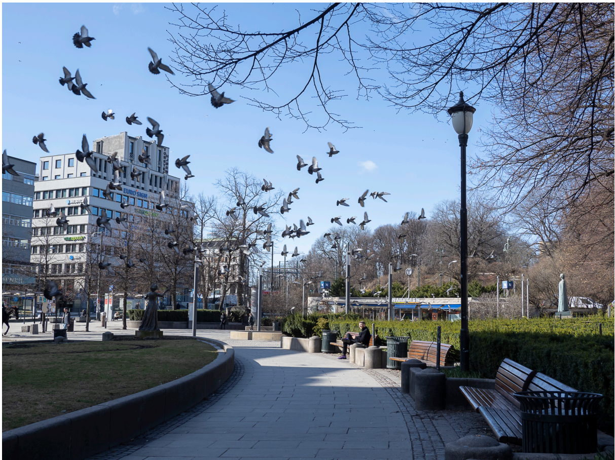
Bare fuglene skaper liv på denne fredag ettermiddag i slutten av mars.