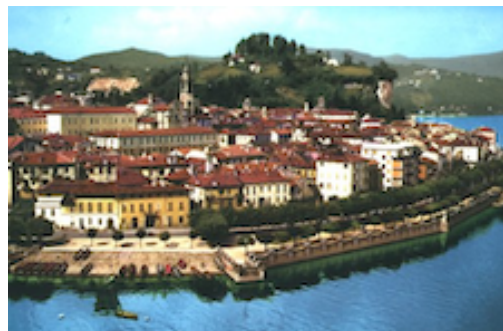
Arona ved Lago Maggiore, Piemonte.