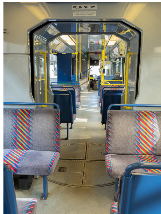
Ingen problemer med å hold avstand på denne avgangen.

fullt mulig å gå ut for å få en tur og frisk luft. – Vi må bare huske å holde avstand til andre. Og heldigvis er det vår, så ingen behøver å være redd for å skli og falle ute i hvert fall, understreker Husebye. Han er redd for at «unntakstilstanden» kommer til å vare – kanskje ut året. – Og seniorsentrene kommer neppe til å åpne igjen på denne siden av sommeren, sier bydelslederen.