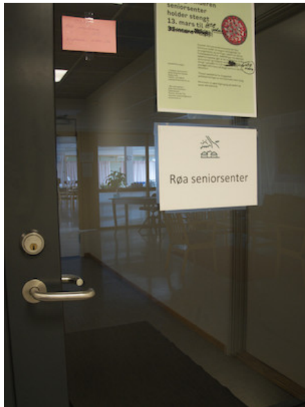
Lukket og mørkt på Røa seniorsenter

Bydelen har også opprettet «Senior-telefonen», som er ment som en veileder for seniorer i bydelen. Har du spørsmål om hvordan du skal gå fram hvis du føler deg syk, eller om hvilke tilbud som finnes