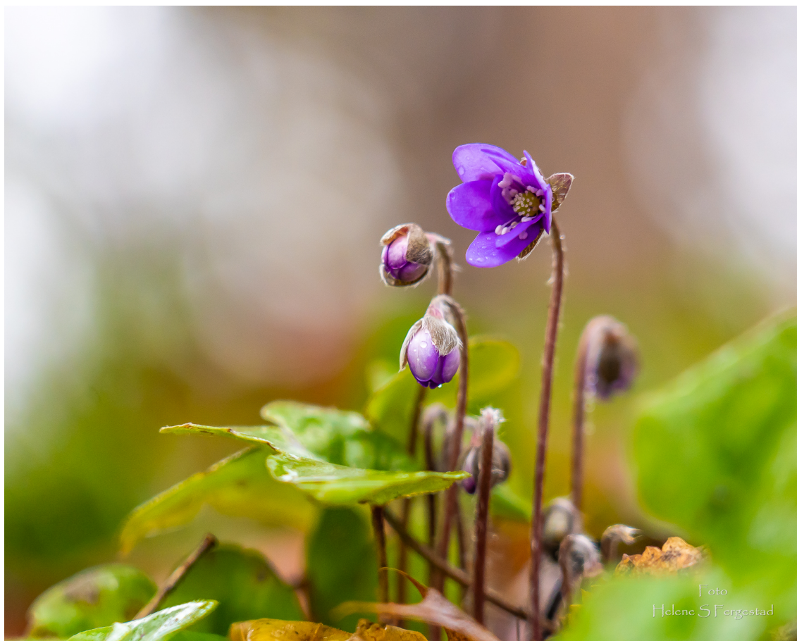
Blåveisen strekker seg mot morgenlyset og er en gledespreder for alle som passerer på stien langs Vækerøstranda.