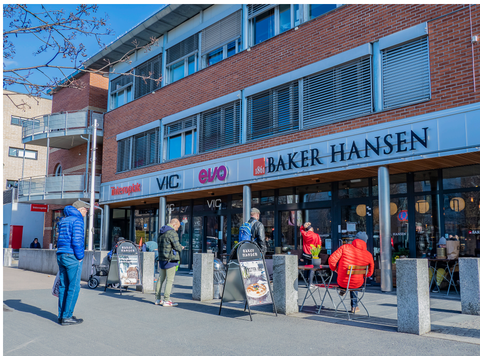
Når seniorsenteret er stengt, får man trøste seg med en kake.

Vi håper at dere holder dere friske, og at vi ses snart igjen på senteret.